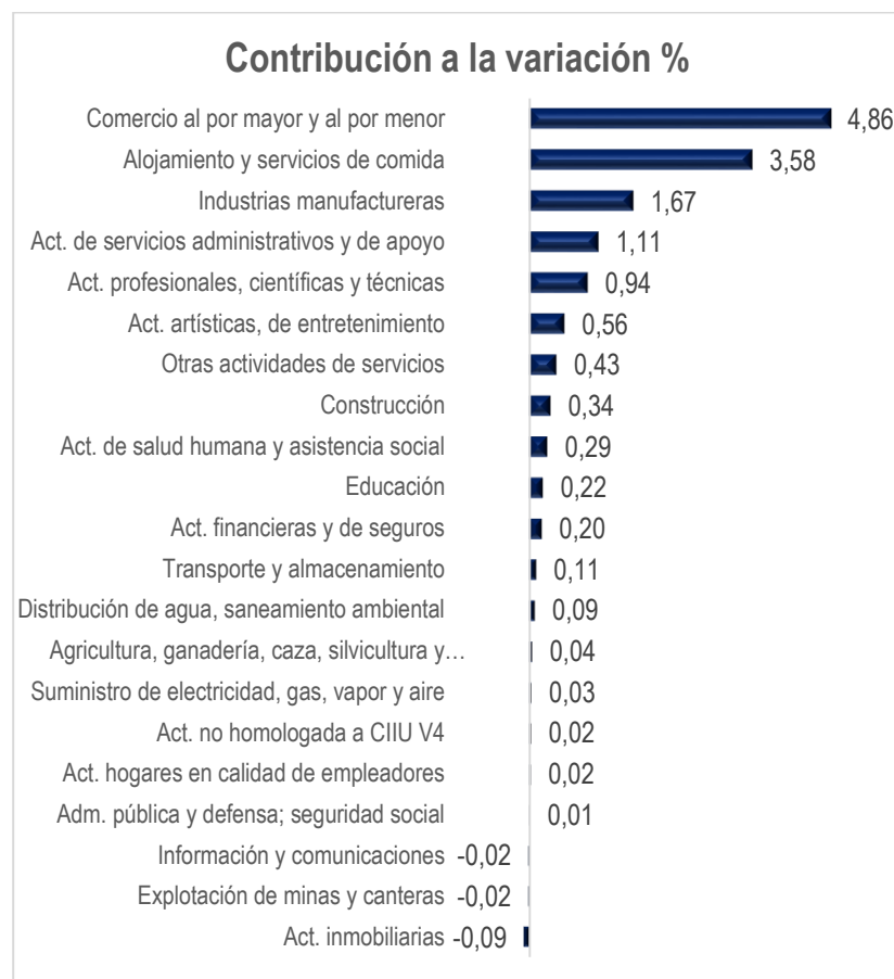
Gráfico 4. Contribución a la variación en el total de personas naturales nuevas, 2016/15