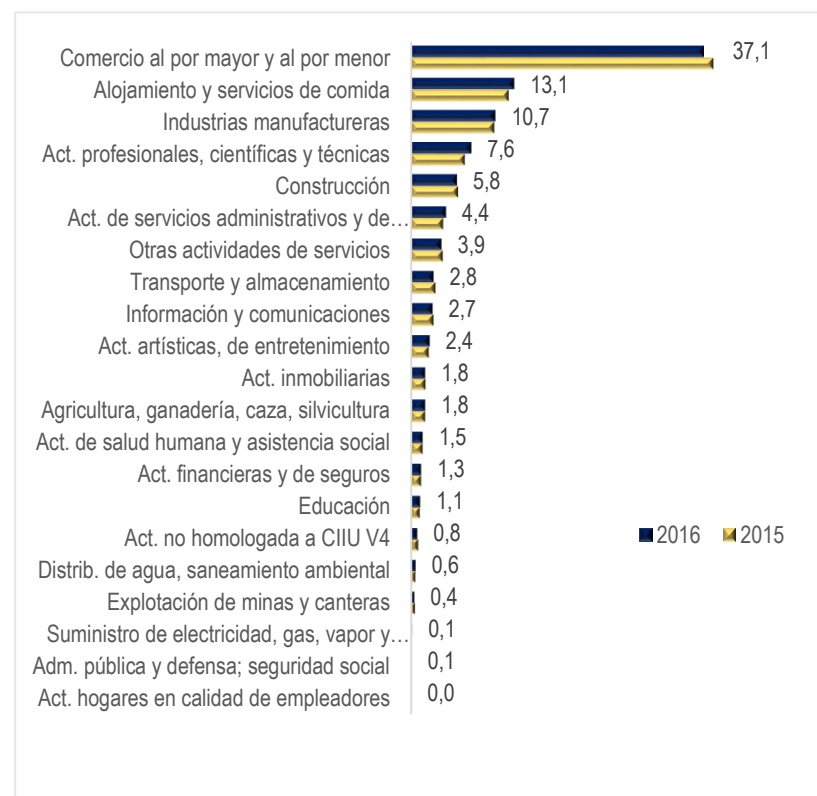
Gráfico 2. Unidades productivas nuevas por actividad económica, 2016/15